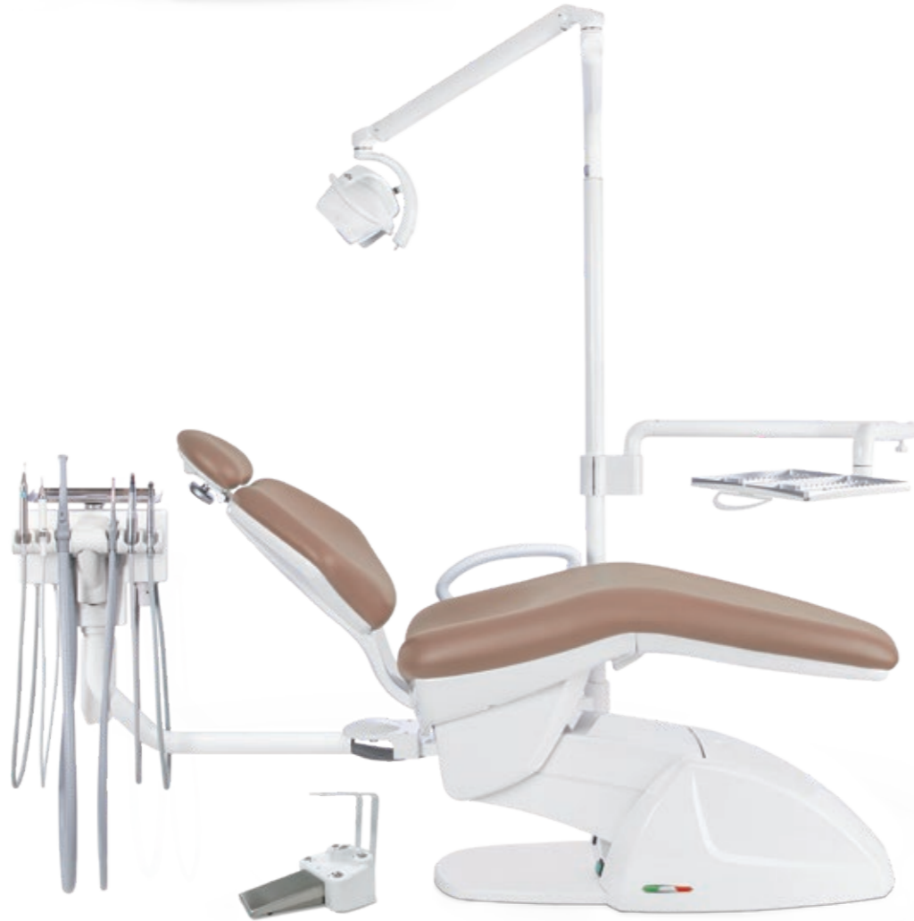
ISOFLEX MODULAR/ ORTHO